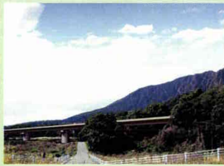
■島原中央道路[完成予想図]