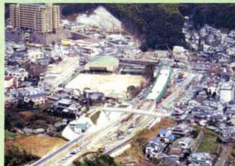
■県道長崎南外環状線(戸町~田上間)