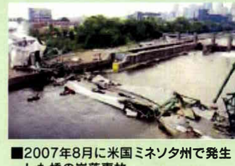
■2007年8月に米国ミネソタ州で発生した橋の崩落事故 [写真:道路橋の予防保全に向けた有識者会議資料より抜粋]