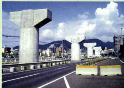
■西九州道(佐世保道路)