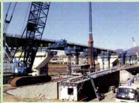
■県道諫早外環状線(仲沖工区)